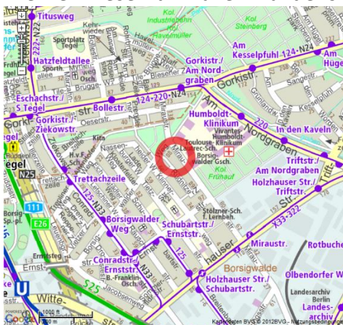
Toulouse-Lautrec-Schule, Miraustr. 120-126, 13509 Berlin