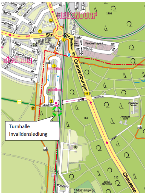
Werner-Frese-Turnhalle Invalidensiedlung, Stahleweg 1, 13465 Berlin